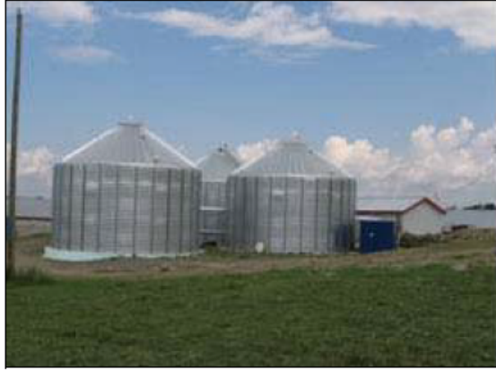
Figure 4-1 Biodigesteurs isolés thermiquement