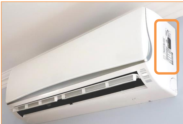
Exemple d'unité intérieure d'une thermopompe à air minibloc sans conduit (dite « murale »)